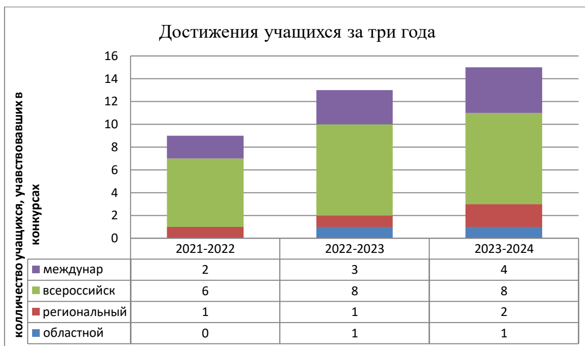
Рисунок 2. Относительная динамика числа участников конкурсных мероприятий за три года

Стоит особо подчеркнуть, что дополнительная общеобразовательная общеразвивающая программа «Маленькие мастера» интересна и востребовательна у детей